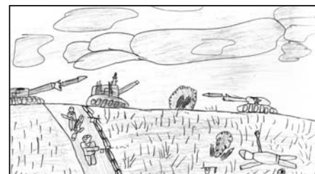
Рис. Снежаны Карауловой. «Но заболела душа: помрет - и забудут его, не будут знать, как воевал, рыл окопы, ходил в атаку, как проливал кровь за тех, кому суждено жить после...»