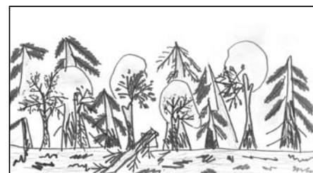
Рис. Снежаны Карауловой. «...верхушки берез во время ночных перестрелок будто скосило литовкой».