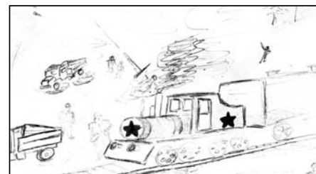
Рис. Оли Стрельниковой. «Эшелон недалеко отошел, налетели фашистские стервятники, мы стали выскакивать из вагонов...»