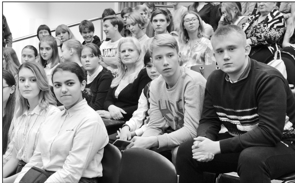
■ Зал полон.